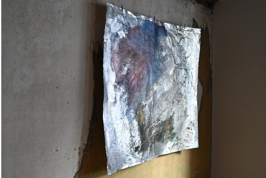
Arbeit auf Alu von Olga Titus.