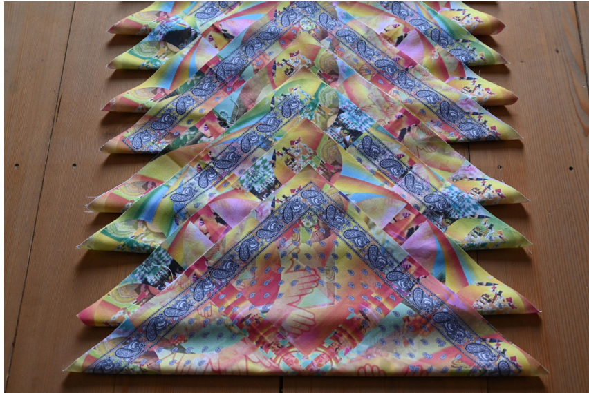
Glarner Tüechli, repetitiv angeordnet (Olga Titus).

Der vermeintliche Paradiesgarten nimmt Bezug auf textile Muster bzw. die Geschichte der Textilindustrie in der Ostschweiz. Für Olga Titus ist die Beschäftigung mit der Textilindustrie auch ein autobiografisches Projekt: Sie wurde in Glarus als Tochter einer Bündnerin und eines Inders geboren, der in 2. Generation in Malaysia lebte. Aus Indien wurden im Zuge der Kolonialherrschaft Stoffmuster wie das Paisley-Muster (eingerolltes Palmblatt) zunächst nach Holland gebracht und gelangten dann auch in die Textilindustrie der Schweiz.